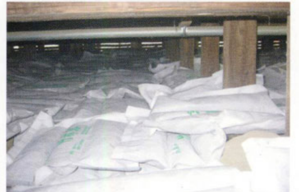
銀閣寺本堂床下状況