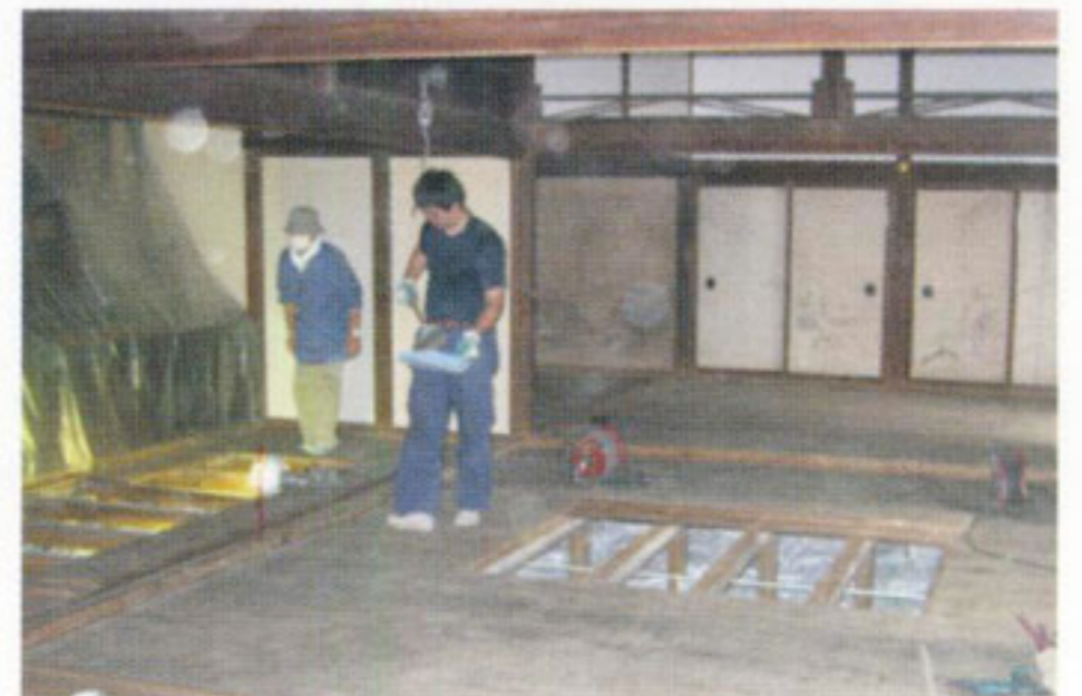
銀閣寺本堂室中の間