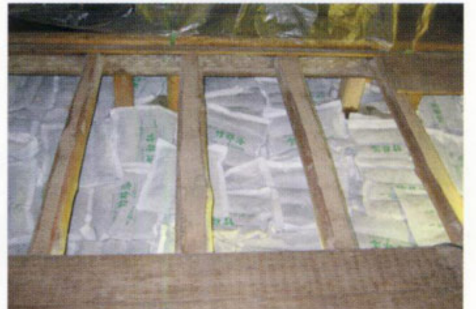
銀閣寺本堂敷き込み状況